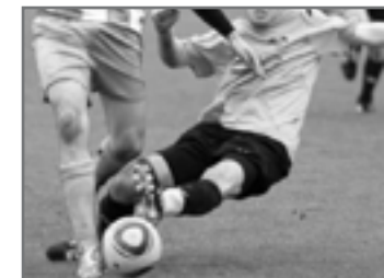
In die Bresche springen.