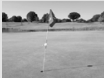
Analysieren & Ziele definieren.