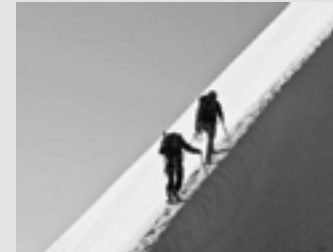
Umsetzen & verbessern.