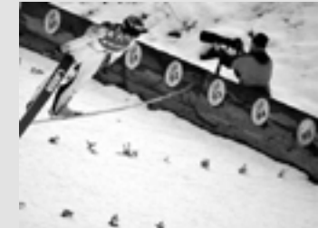
Erfolge messen & kommunizieren.